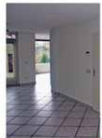
OUDE SITUATIE VANUIT WOONKAMER NAAR DE KEUKEN

5 Grotere bijkeuken. Door een stuk van de garage bij de bijkeuken te betrekken komt er meer ruimte voor wasmachine, droger etc.