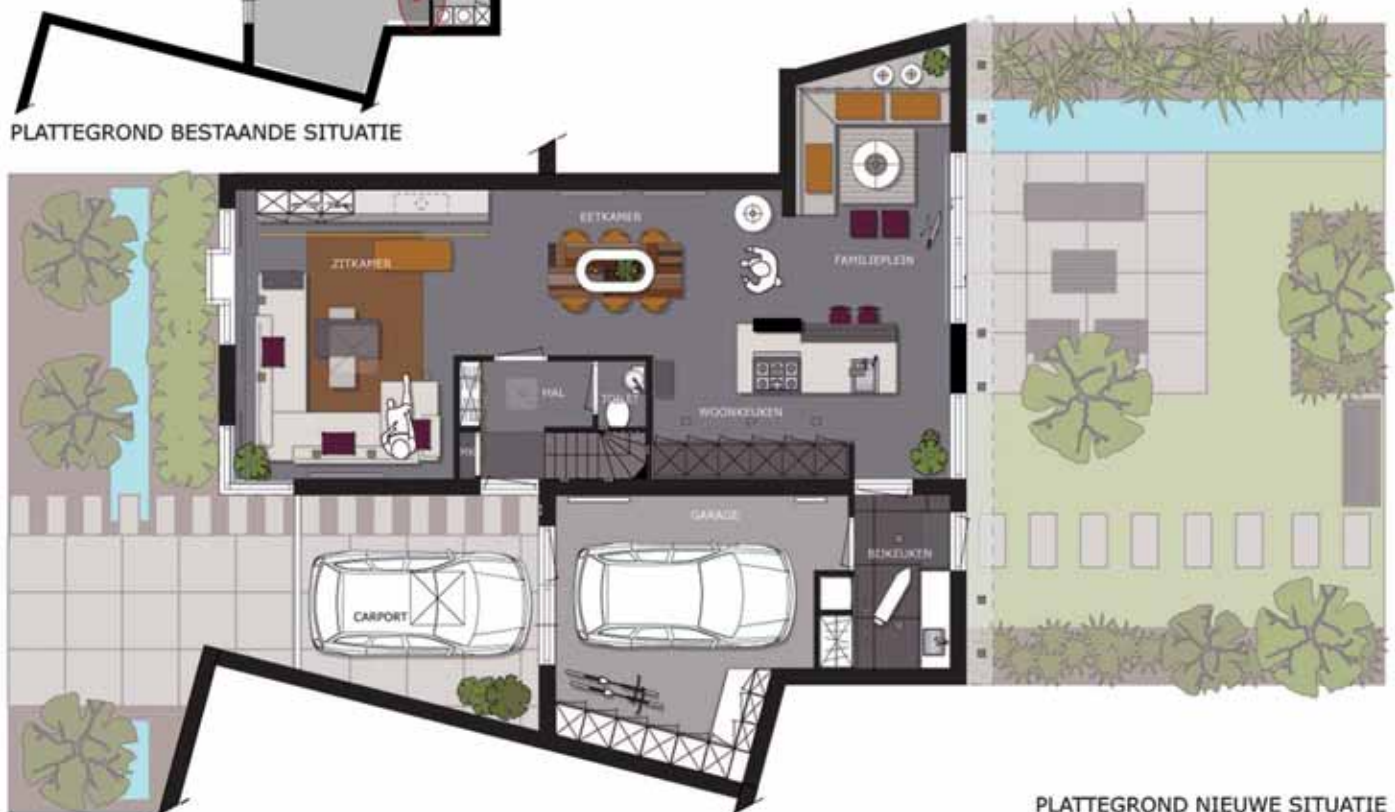
PLATTEGROND NIEUWE SITUATIE