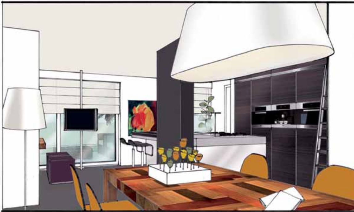
SFEREBEELD VANUIT DE EETKAMER NAAR DE WOONKEUKEN