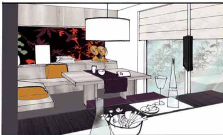
SFEERBEELD VANUIT DE WOONKEUKEN NAAR HET FAMILIEPLEIN

Met relatief kleine bouwkundige ingrepen en een goed kleurenplan kan een huis een complete metamorfose ondergaan.