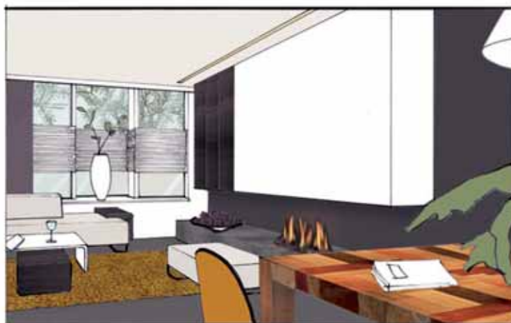
SFEERBEELD VANUIT DE EETKAMER NAAR DE HAARD

4 Een opgeruimde entree. Die wordt gecreëerd door de deur van de meterkast te verwijderen en de muur tussen garderobenis én meterkast een stukje in te korten. Vervolgens komen er schuifpanelen voor meterkast én garderobenis. Gasten kijken daarvoor bij binnenkomst niet meer tegen een berg jassen, schoenen en tassen aan. De panelen kunnen in elk gewenst dessin, van een boslandschap tot een foto van New York by night.