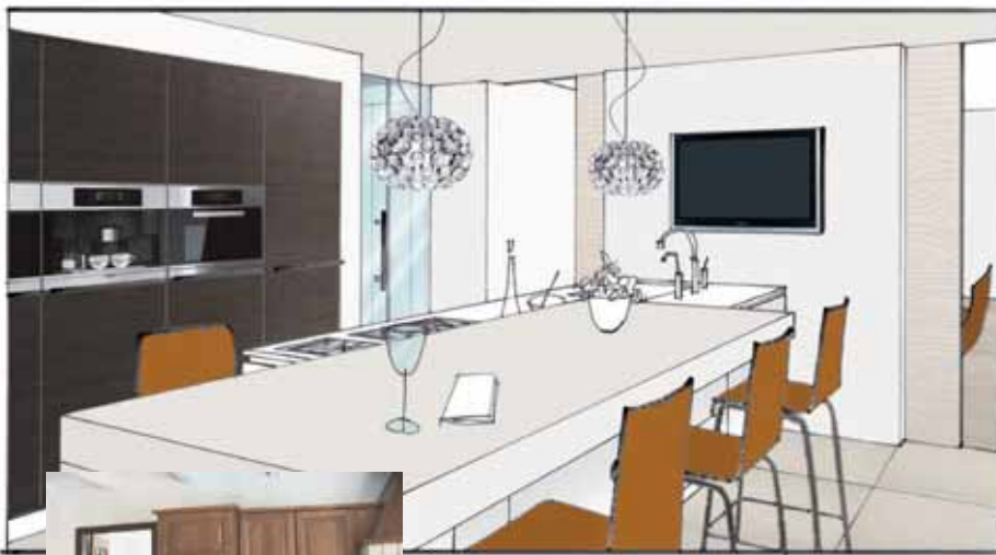
Perspectief 2: De woonkeuken.