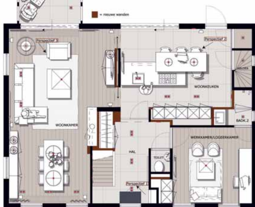
Plattegrond nieuwe situatie

De houten vloerdelen en de tegelvloer zijn in lichte tinten met een frisse uitstraling. Zij zorgen tevens voor een rustige overgang tussen de verschillende ruimtes.