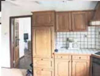
Perspectief 2: De woonkeuken

W OONKEUKEN De bewoners willen graag een kookeiland. De bestaande keuken is daarvoor te klein. Om de wens toch te realiseren, zijn volgens Ad Vermeulen de volgende aanpassingen nodig: