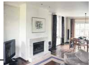
De bestaande woonkamer.

In de scheidingswand naar de woonkamer kunnen twee schuifpanelen verdwijnen. Daardoor ontstaat de mogelijkheid de ruimtes gesloten of open te houden. De panelenwand bij de kelder en de bergkast verbergt de onrustige wand met deuren en is ook nog te gebruiken als meubord of krijtwand. Door een nieuwe schuifpui in de gevel te plaatsen ontstaat een prachtig uitzicht op de tuin en stroomt er een zee van licht naar binnen.