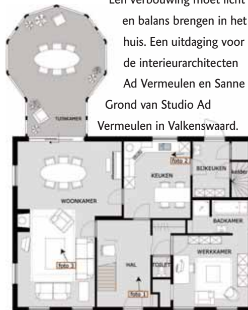
De plattegrond bestaande situatie