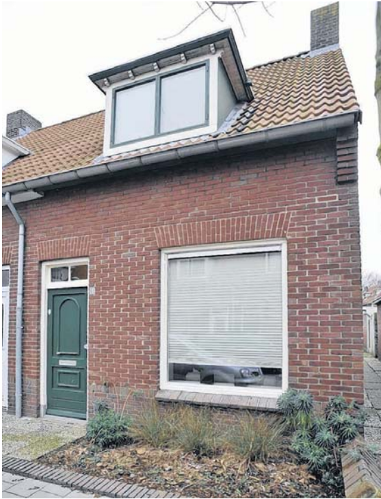
De voorkant van de woning met de oude voordeur die nog moet worden vervangen.

zen hier ontzettend hoog liggen, als je niet staat ingeschreven. Kopen was net zo duur, tenminste in de goedkopere wijken. We zijn naar dit huis gaan kijken en hebben het binnen een dag gekocht."