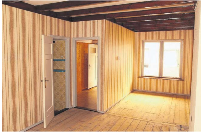
En zo zag de woning er van binnen uit, toen Sanne en Percijn het pand kochten.

Hergebruik staat dus centraal in de inrichting, aangevuld met persoonlijke souvenirs. Zoals de koperen