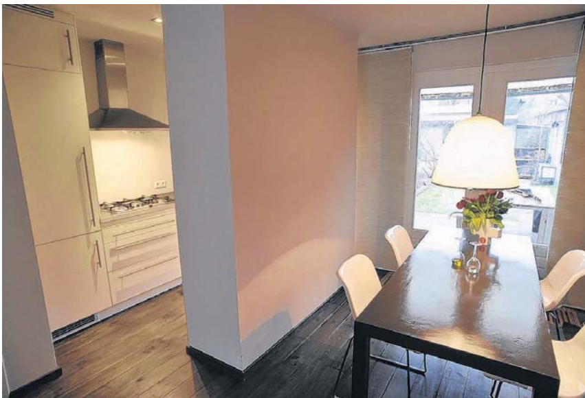
Door de muur tussen keuken en kamer te vervangen door een kolom is er meer ruimte gecreëerd.