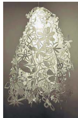
De lamp in het trapgat.