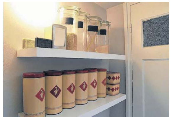
Een rijtje oude beschuitbussen van Bolletje in de keuken.