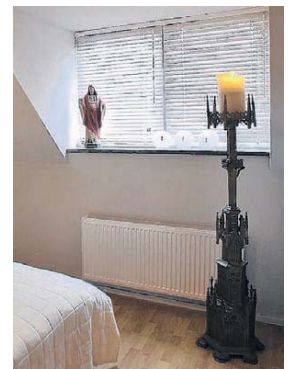
Een bijzondere kandelaar in de slaapkamer, afkomstig uit een Zeeuwse kerk.