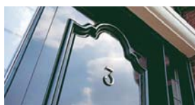
BINNENKIJKEN BIJ ...

Wie? Sanne Grond (30) interieurarchitect en Percijn Vlaming (28), student architectuur aan de TUE en deeltijdstudent