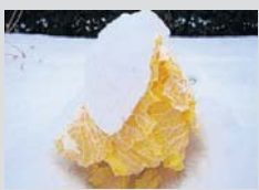
Savoiekoel in de winter.

Waarom zou je een appelboom in je tuin planten als je de jona-golds in de supermarkt voor een habbekrats kunt kopen? Juist, omdat de jona-golds je soms de neus uitkomen en je wel eens een andere appel wilt proeven. Nu zal een speciaalzaak best andere apperassen aanbieden, maar voor wie goede herinneringen heeft aan de notarisappels en de bellefleur van vroeger, zit er maar één ding op: zelf planten. Hetzelfde geldt voor het kweken van groenten. Die zijn zo belachelijk goedkoop in de supermarkt, dat je waarschijnlijk weinig geld spaart als je je eigen wortelen zaait of spruiten plant. Maar wat voor fruit geldt, gaat ook op voor groenten: ben je gehecht aan de smaak van een bepaald ras, dan zul je dat zelf moeten kweken. Verse doperwtten bijvoorbeeld, zijn nu al nauwelijks meer te krijgen. Hele generaties weten niet beter of doperwtten koop je diepgevroren of ingeblikt. Als je ze toch kunt kopen, heb je geen keuze. De leverancier ziet je komen. Waarschijnlijk kijkt hij je met open mond aan als je opmerkt dat je Regent toch net iets fijner van smaak vindt dan Marktveroveraar. Nu wil ik heus niet terug naar de tijd waarin we gezellig met het gezin rond de tafel zaten om erwten te doppen, want als ik me goed herinner, deed ik dat als kind met frisse tegenzin. Ik wil alleen maar beweren dat wie van groenten houdt en dat wie geïnteresseerd is in smaak, is aangewezen op eigen teelt.