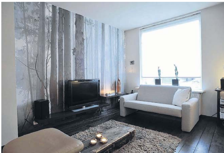
Een fotowand met berken in de voorkamer.